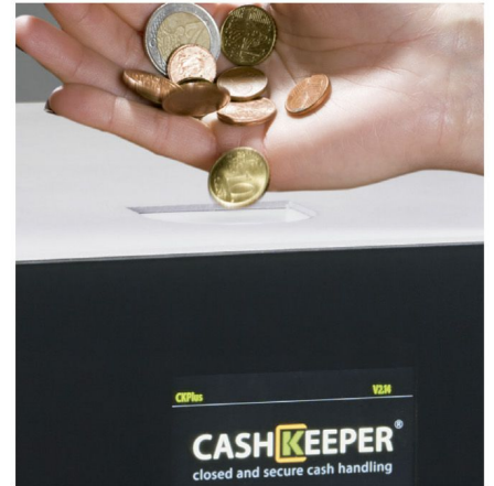
Acepta, valida, recicla y paga todas las monedas