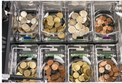
Cada moneda tiene su propio hopper Máxima fiabilidad y rapidez