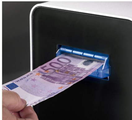
Acepta y verifica todos los billetes, incluyendo el de 500 €