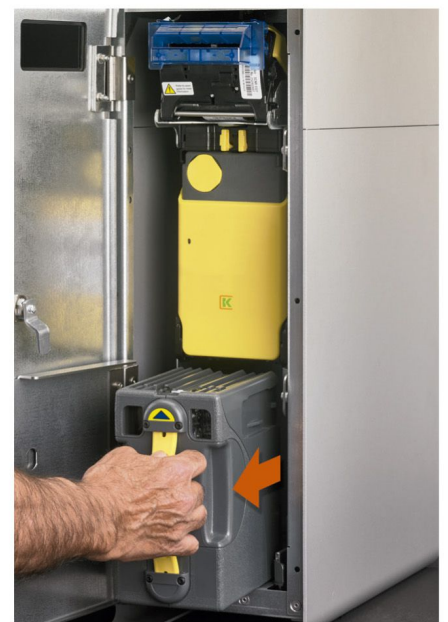
Recaudación de billetes en un módulo cerrado. Nadie ve ni toca el dinero